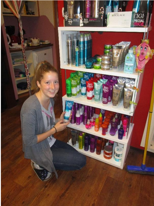
Kerstin Ganser Schnittstelle - Friseur Palfau