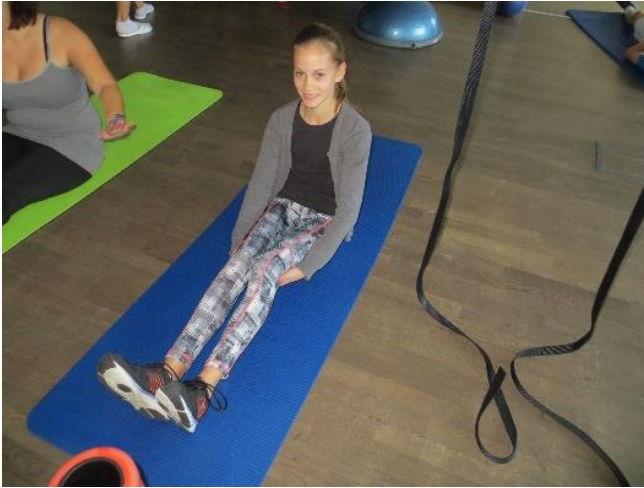
Schrefel Elisabeth Emotion Life Center Göstling/Ybbs