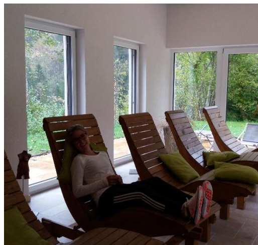
Philipp Stoll Holzbau Heigl Lunz am See